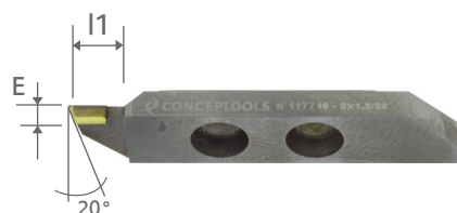
Type 7410 - A DROITE On the right