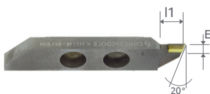
Type 7310 - A GAUCHE On the left